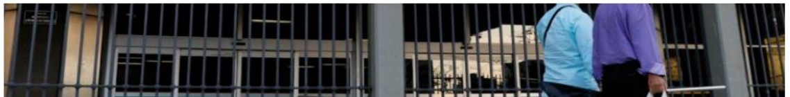
Os ajustes da Petrobras passaram a vigorar na 3ª feira (28.dez.2021)

Bernardo Gonzaga 3.jan.2022 (segunda-feira) - 23h11